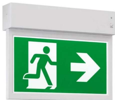
PICTOLIGHT 1P-W/C (Wall/Ceiling)